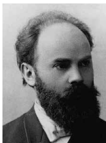
יהודה לייב (לאון) רבינוביץ'. צילום: קונסטנטין אבא שפירא, סנט פטרבורג, תרנ"ה. אוספי הספרייה הלאומית. מקור: ויקיפדיה