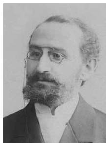
ישראל חיים טביוב. מקור: ויקיפדיה