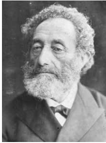
אלכסנדר הלוי צרבוים, 1885. אוסף שבדרון, אוספי הספרייה הלאומית, תרומת קונסטנטין שפירא. מקור: ויקיפדיה