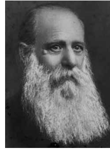
משה לייב ליליינבלום, שנות השבעים של המאה התשע-עשרה.

יהיה מכ"ע לכל בית ישראל, בו תתבררנה דעות כל מפלגות ארצנו וחפצן. המליץ יהיה למליץ בינותן להרבות שלום בישראל". הוא יפנה אל "המשמיעי דבר אחד בסגנונים שונים, החושבים איש את אחיו למתנגדים גדולים, רק באשר איש לא ישמע שפת רעהו"; "בשביל הזהב נלך בלי לנטות ימין ושמאל", הבטיח רבינוביץ'. עם זאת סיפר כי "גאוני הדור חכמיו וסופריו מחזקים את ידיו ודורשים את טובת המליץ, ובישר כי "המליץ יפיץ אור ודעת" וכך "ימצאו בו הקוראים מאמרים מדע ברוח היהדות", והוא ישתדל "לתת לקוראיו מושג נכון מכל חדשה בחכמה אשר על פיה נבין דברי תורתנו הקדושה. המליץ יפיץ אור על העבר, להבין כי גם העבר הקרוב לנו פעל הרבה מאד לחזק את האמונה, להגדיל כבוד התורה, להרבות בזה כחות האומה" 12 . לכן, אחרי הפתיחה האופטימית של מכתבו מסייג אחד העם את דבריו ואמר: "אך זאת אולי יפלא בעיניך, אם אומר לך כי בדבריך אלה לא מצאתי את כל אשר בקשתי, ותחת זה מצאתי את אשר לא בקשתי". הוא ציטט מדברי רבינוביץ' והציג שאלות שנועדו להצביע על הסתירות הפנימיות שבהן, המוכיחות כי קשה מאוד יהיה לבחור בשביל הזהב בין המפלגות, כי ההבדל איננו מסתכם בסגנון, אלא גם בדעות. למשל: