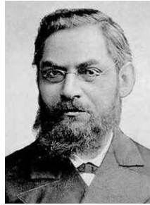
יהודה לייב גורדון. אוסף רויד ב' קיידן, אתר הארכיון הציוני. מקור: ויקיפדיה