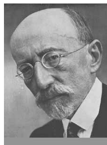
אחד העם (אשר צבי הירש גינצברג).